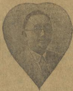
Sinshe : LAW CHEE MING L.T.T.

Pada 3 taon jang laoe saja mendapet penjakit badan mati sebelah, kaki loetoet pada bengkak dan tida bisa bergeser, hingga soeda berobat pada Dokter en Sinshe di ini kota tapi tida terioeloang, maka oentoeng dengan perantara'annja saja poenja sobat, seja soeda dapet pertoeloengannja sinshe tersebet.